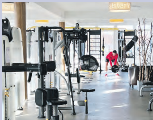
Die Alsterfit-Studios verfügen über helle, großzügige Räumlichkeiten, in denen mit Abstand trainiert wird.

Das Besondere: Die zertifizierten Fitnesstrainer und Sportwissenschaftler, die alle in Festanstellung tätig sind, sowie die erfahrenen Physiotherapeuten arbeiten eng zusammen. Sie bieten eine erstklassige Beratung, betreuen die Mitglieder intensiv und unterstützen sie bei der Verwirklichung der persönlichen Ziele. Davon profitieren vor allem Trainingsanfänger, denn wer über längere Zeit falsch trainiert bzw. Übungen nicht richtig ausführt, schadet seiner Gesundheit. So können beispielsweise Schäden an Sehnen, Bändern und Gelenken die Folge sein.