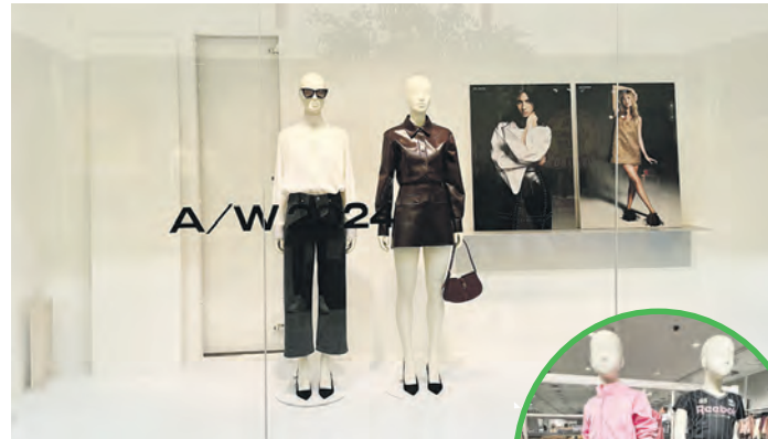
In den Modefachgeschäften sind die neuen Kollektionen eingetroffen.

Wie das Hamburger Abendblatt berichtete, wird die Postbank bis 2026 insgesamt neun der derzeit noch 19 Filialen in der Hansestadt schließen, darunter die Standorte in Rahlstedt und Bramfeld, die es bereits ab kommendem Jahr nicht mehr geben wird. Weitere fünf Filialen werden in sogenannte „Beratungsfilialen“ umgewandelt und konzentrieren sich dann ausschließlich auf das Kerngeschäft