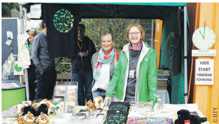
Auf dem Fest präsentieren sich zahlreiche Vereine und Organisationen.

Schnäppchenjäger können auf einem großen Flohmarkt fündig werden und für die Kleinen gibt es ein buntes Kinderprogramm. Tierisch tolle Gewinne hält die Tombola bereit und auf der Bühne werden einige Tierheimschützlinge sowie teilnehmende Tierschutzorganisationen präsentiert. Für das leibliche Wohl der Gäste sorgen vegane Köstlichkeiten.