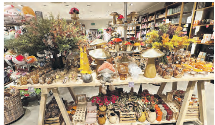
Herbstliche Dekorationsideen bietet das Geschenkhaus Nanu-Nanu.