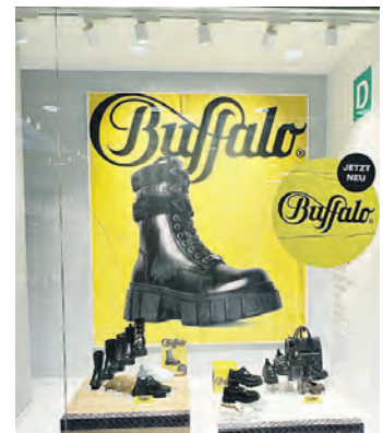
Bei Deichmann gibt es die aktuellen Schuh-Trends.

Für ihren Einkauf stehen den Kundinnen und Kunden im direkten Bereich des Centers mehr als 1.000 kostenlose Parkplätze zur Verfügung. Außerdem können zusätzlich insgesamt 18 Ladestationen für Elektrofahrzeuge genutzt werden, die sich gegenüber der Zufahrt zum Parkdeck befinden.