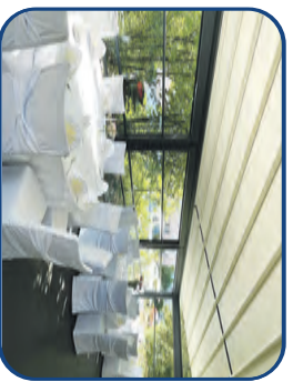
Neuer Sommergarten bis zu 40 Personen