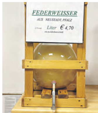
Der neue Federweißer ist da.

Sogar kulinarisch lässt sich die neue Jahreszeit entdecken – und zwar mit Pfälzer Federweißer, der ab sofort im Wein-Shop erhältlich ist, mit Neu-Kreationen bei Tee & Gewürze sowie mit zahlreichen anderen Leckereien, die man bei Arko, bei Südländische Spezialitäten und beim Heideschlachter Dehning sowie in den Bäckereien Asadian und Dallmeyers Backhaus bekommt. Genießen können die Besucherinnen und Besucher des Centers aber auch vor Ort. Hier empfehlen sich die Pizzeria Sale Pepe, in der