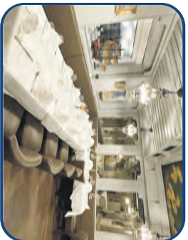
Bauernstube bis zu 20 Personen