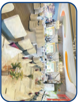
Großer Festsaal bis zu 110 Personen

Für Weihnachtsfeiern sowie alle anderen Familienfeiern und Firmenveranstaltungen stehen Ihnen moderne Räumlichkeiten mit Platz für bis zu 240 Personen zur Verfügung.