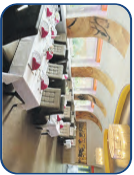
Restaurant bis zu 40 Personen