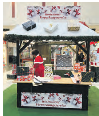
In der unteren Ladenstraße kann man seine Weihnachtsgeschenke kostenlos verpacken lassen.

Selbstverständlich stehen den Kundinnen und Kunden auch in der Vorweihnachtszeit die mehr als 1.000 Parkplätze kostenlos zur Verfügung. Außerdem können die 18 Ladestationen für Elektrofahrzeuge genutzt werden, die sich direkt gegenüber der Zufahrt zum Parkdeck befinden.