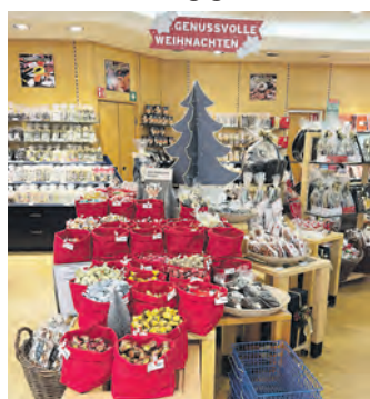
Bei Arko gibt es Süßes für den bunten Teller.

Auch die kulinarischen Leckereien dürfen natürlich nicht fehlen. Der Weihnachtstisch ist reich gedeckt und die Besucher/innen können zwischen leckeren Backwaren und herzhaften Genüssen sowie Wurst- und Schinkenspezialitäten der Firma Lothar Burghardt wählen. Zu einer Pause nach dem Einkaufsbummel laden die hier ansässigen Gastronomiebe-