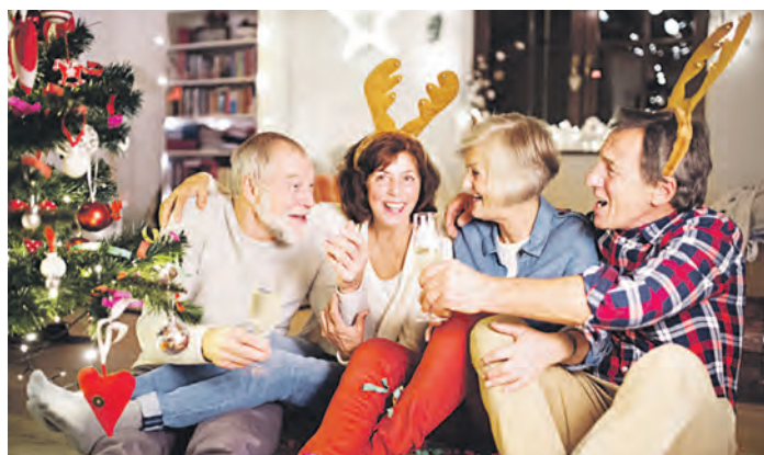
Allein an Weihnachten? Das muss nicht sein!

und das Freiwillige Ökologische Jahr sind für ein Jahr angelegt. Die in dieser Zeit gezahlten Beiträge zur Rentenversicherung werden im Rentenkonto gespeichert und zahlen sich später aus: Sie erhöhen die künftige Rente und zählen zudem als Wartezeit, mit denen Rentenansprüche erfüllt werden können. Die Broschüre „Freiwilligendienst und Rente“ kann unter www.deutsche-rentenversicherung.de heruntergeladen werden. Das Team am Servicetelefon hilft Ratsuchenden zudem unter der kostenfreien Hotline 0800 1000 48022 gerne weiter.