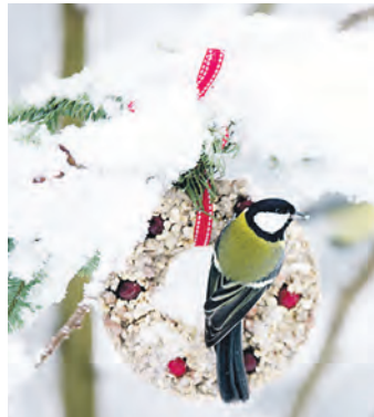
Meisen lieben auch Gemische aus Fett und Samen, die man als Meisenknödel kaufen kann.

Vor dem Beginn der Fütterung steht die Wahl des richtigen Behälters. Grundsätzlich empfiehlt der NABU einen Futterspender, der das Futter vor Nässe und Witterungseinflüssen schützt, denn Nässe im Futter kann zur Ausbreitung von Krankheitserregern führen. Am besten eignen sich daher sogenannte Futtersilos, die im Gegensatz zu den offenen Futterhäuschen auch die Verunreinigung durch Vogelkot verhindern. Wer dennoch ein offenes Futterhäuschen nutzt, sollte es regelmäßig mit heißem Wasser reinigen und täglich nur wenig Futter nachfüllen.