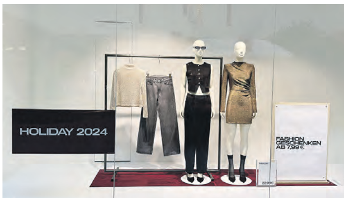
Modisches für die Festtage bieten die Bekleidungsgeschäfte.

wie mit einer künstlichen Schneedecke versehenen Ständen jede Menge zum Staunen: von Geschenkartikeln wie beispielsweise Tischdecken und Patchworkarbeiten über Wohnaccessoires und Dekorationsartikeln bis hin zu Mützen und beleuchteten Ballons reicht das Angebot. Am Stand von „Seifenwiese“ findet man zudem handgefertigte Seifen, Badekugeln und -salze sowie verschiedene Körperpflegeartikel.