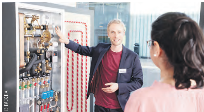
Die Begleitung durch die Hamburger Energielotsen kann dazu beitragen, dass Ratsuchende ihr Vorhaben erfolgreich beenden.

Wir kaufen Wohnmobile + Wohnwagen Telefon: 03944-36160 www.wm-aw.de Fa.