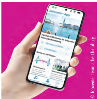
Die neue App steht ab sofort zum Download bereit.

Die App leistet auch einen wichtigen Beitrag hin zum Ausbau der sicheren Online-Kommunikation der BA. Neben dem Online-Portal stellen die Kunden-Apps die sichere Alternative zum Mailversand im Kundenverkehr dar. Die