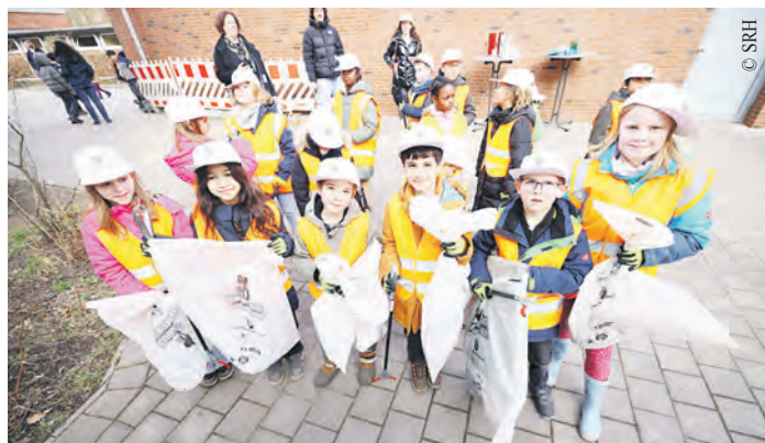
Putzmuntere Hamburgerinnen und Hamburger säubern in diesem Jahr vom 28. Februar bis zum 9. März ihre Stadt.

Die SRH freut sich auf viele Freiwillige, stellt ihnen kostenlos Handschuhe und Müllsäcke zur Verfügung und kümmert sich um die umweltgerechte Verwertung