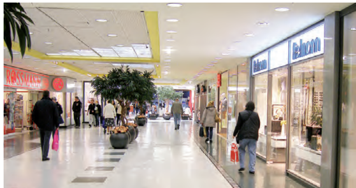
Klar strukturiert präsentiert sich der Innenbereich des Centers.