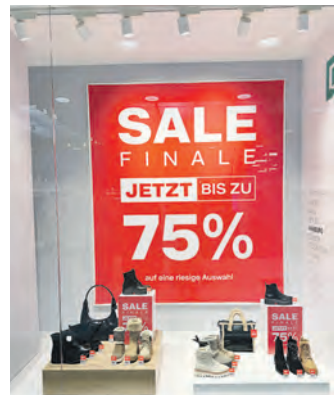
In vielen Geschäften wurden die Preise kräftig reduziert.

Während sich die Kunden noch mit kuschelig-warmer Winterware eindecken, ist der Einzelhandel schon einen Schritt weiter. In einigen Geschäften, wie beispielsweise im Geschenkehaus Nanu-Nana, ist alles bereits auf Frühling eingerichtet. Die Modefachgeschäfte werden nachziehen, sobald in den Lagern Platz für die neue Kollektion geschaffen wurde. Welche Trends uns im Frühjahr/Sommer 2025 erwarten, lesen Sie in der nächsten Ausgabe der RUNDSCHAU.