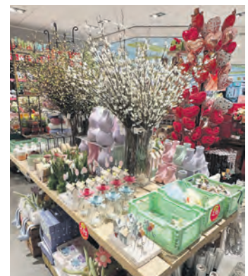
Bei Nanu-Nana hat bereits der Frühling Einzug gehalten.

Für ihren Einkauf stehen den Kundinnen und Kunden im direkten Bereich des Centers mehr als 1.000 kostenlose Parkplätze zur Verfügung. Außerdem können zusätzlich insgesamt 18 Ladestationen für Elektrofahrzeuge genutzt werden, die sich direkt gegenüber der Zufahrt zum Parkdeck befinden.