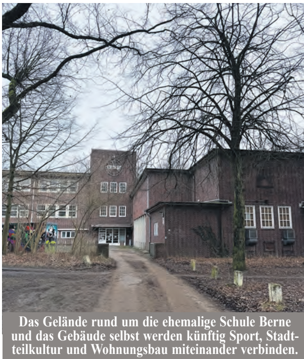
Das Gelände rund um die ehemalige Schule Berne und das Gebäude selbst werden künftig Sport, Stadteilkultur und Wohnungsbau miteinander verbinden.

Mitte Dezember vergangenen Jahres hat die Bezirksversammlung Wandsbek der Feststellung des neuen Bebauungsplans an der Lienastraße (Farmesen-Berne 39) zugestimmt. Hier sollen die planungsrechtlichen Voraussetzungen geschaffen werden, um auf dem Gelände der im Jahr 2016 geschlossenen Schule eine Wohnbebauung zu realisieren. „In Hamburg wird weiterhin dringend Wohnraum benötigt, und mit der Feststellung des Bebauungsplans an der