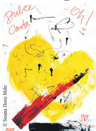
Titel: „Oh! dulce canto“ (Oh! süßes Lied).

Die Ausstellung lädt Besucherinnen und Besucher dazu ein, ge-