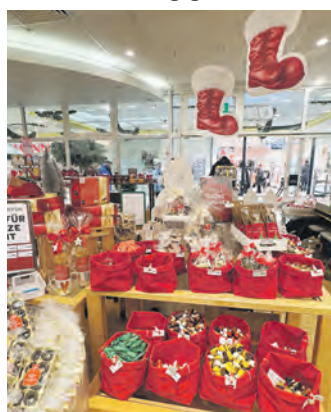
Bei Arko gibt es Süßes für den bunten Teller.

Auch die kulinarischen Leckereien dürfen natürlich nicht fehlen. Der Weihnachtstisch ist reich gedeckt und die Besucher/innen können zwischen leckeren Backwaren und herzhaften Genüssen wählen. Zu einer Pause nach dem Einkaufsbummel laden die hier ansässigen Gastronomiebetriebe mit einem breit gefächerten Angebot an Speisen und Getränken ein.