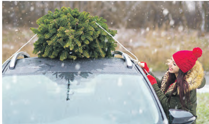
Für den Transport auf dem Autodach sichert man den Weihnachtsbaum am besten mit Spanngurten am Dachträger.

Wenn der Weihnachtsbaum nicht in den Kofferraum passt, dann transportieren Sie ihn am besten auf dem Dach. Auch hier muss der Baumstamm in Fahrtrichtung zeigen. Genau wie im Kofferraum sollte der Weihnachtsbaum durch Spanngurte erst am Stamm, dann einmal um den Baum herum gesichert werden. Das geht am leichtesten, wenn Sie diese am Dachträger festzurren. Damit der Baum keine Kratzer im Auto oder auf dem