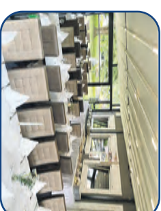
Neuer Wintergarten bis zu 40 Personen