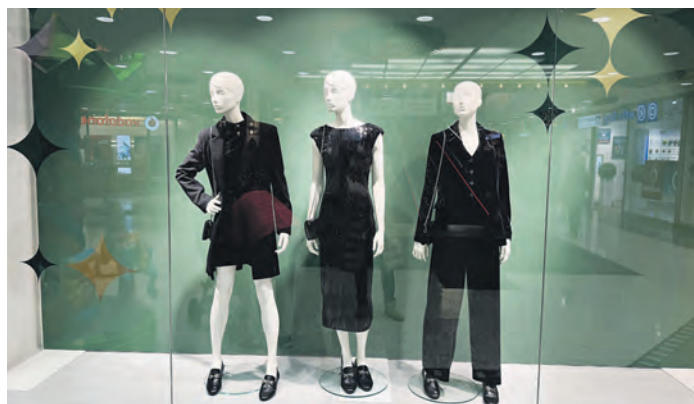
Modisches für die Festtage bieten die Bekleidungsgeschäfte.

wie mit einer künstlichen Schneedecke versehenen Ständen jede Menge zum Staunen: von Geschenkartikeln wie beispielsweise Tischdecken und Patchworkarbeiten über Wohnaccessoires bis hin zu Dekorationsartikeln reicht das Angebot. Am Stand von „Seifenwiese“ findet man zudem handgefertigte Seifen, Badekugeln und -salze sowie verschiedene Körperpflegeartikel.