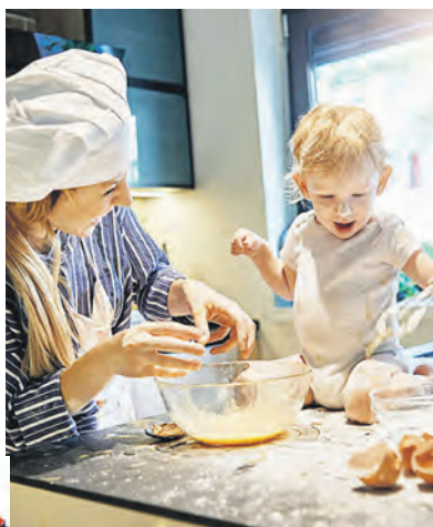
Kinder – auch die Kleinsten – helfen gern beim Plätzchenbacken.

Weihnachtszeit ist Plätzchenzeit – und das schon ziemlich lange. Die Tradition des Backens zu Festtagen gab es bereits in vorchristlicher Zeit. Das haben Wissenschaftler durch Ausgrabungen und anhand von frühen bildlichen Darstellungen herausgefunden. Das Weihnachtsgebäck, wie wir