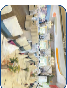
Großer Festsaal bis zu 110 Personen

Für Weihnachtsfeiern sowie alle anderen Familienfeiern und Firmenveranstaltungen stehen Ihnen moderne Räumlichkeiten mit Platz für bis zu 240 Personen zur Verfügung.