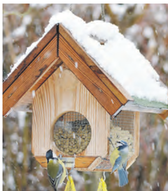
Sonnenblumenkerne oder Freiland-Futtermischungen sind eine gute Wahl.

Vor dem Beginn der Fütterung steht die Wahl des richtigen Behälters. Grundsätzlich empfiehlt der NABU einen Futterspender, der das Futter vor Nässe und Witterungseinflüssen schützt, denn Nässe im Futter kann zur Ausbreitung von Krankheitserregern führen. Am besten eignen sich daher sogenannte Futtersilos, die im Gegensatz zu den offenen Futterhäuschen auch die Verunreinigung durch Vogelkot verhindern. Wer dennoch ein offenes Futterhäuschen nutzt, sollte es regelmäßig mit heißem Wasser reinigen und täglich nur wenig Futter nachfüllen.