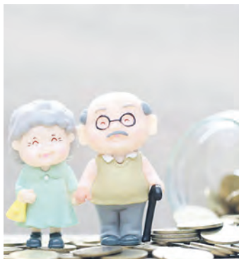
Die Renten sollen zum 1. Juli angehoben werden.

Der steuerliche Grundfreibetrag, also das Einkommen, bis zu dem keine Steuer gezahlt werden muss, steigt. 2026 liegt er bei 12.348 Euro. Auch der Kinderfreibetrag wird angepasst: Für Eltern mit einem gemeinsamen Jah-