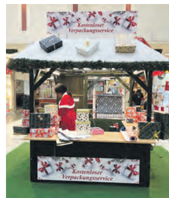
In der unteren Ladenstraße kann man seine Weihnachtsgeschenke kostenlos verpacken lassen.

Selbstverständlich stehen den Kundinnen und Kunden auch in der Vorweihnachtszeit die mehr als 1.000 Parkplätze kostenlos zur Verfügung. Außerdem können die 18 Ladestationen für Elektrofahrzeuge genutzt werden, die sich direkt gegenüber der Zufahrt zum Parkdeck befinden.