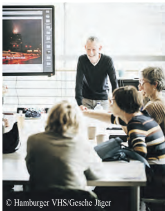
Viele Lernangebote gibt es zum Thema Künstliche Intelligenz.

Die neuen Workshops verbinden Umweltbildung, politische Bildung und kreatives Gestalten. In Zusammenarbeit mit dem Altona-